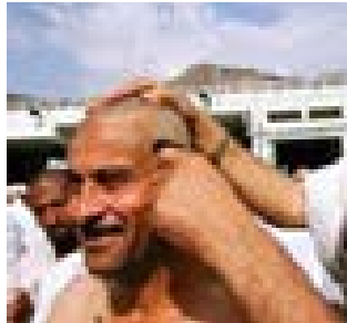
Saçı Traş Etmek