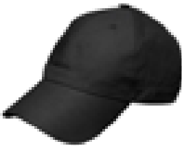
Takke ile Başı örtmek