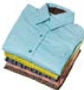
Dikişli Elbise Giymek