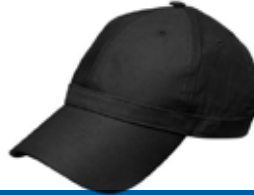
போர்வையால் தலையை மறைத்தல்