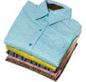
தைக்கப்பட்ட ஆடை அணிவது