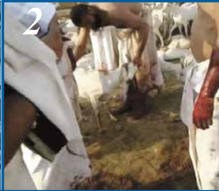
2 ஹத்யு கொடுத்தல்