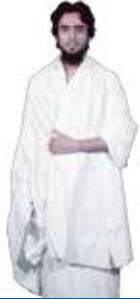
இஹ்ராமுடாய் ஆடையை அணிவது