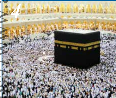
4 தவாபு செய்தல்