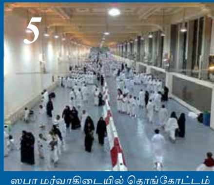
5 ஸபா மர்வாகிடையில் தொங்கோட்டம் ஓடுதல்