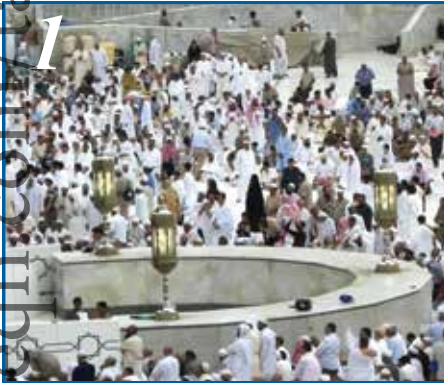
1 ஜம்ரதுல் அகபா விற்கு கல்லேறிதல்

முந்திய ஒழுங்குமுறையில் செய்வது நபிவழியாகும். கற்களை எறிதல் பின்பு பலியிடல் பின்பு முடிகளை சிரைத்தல் பின்பு தவாஃப் செய்தல் பின்பு யார் தொங்கோட்டம் ஓடவில்லையோ அவர் தொங்கோட்டம் ஓடுவார். சிலதை விட சிலதை முட்படுத்துவது கூடும். நபி ஸல் அவர்கள் அதற்கு அனுமதி அளித்தார்கள். ஒருவர் முடியை சிரைத்து பின்னர் கல்லெறிந்தால் அது கூடுமானது. அறுத்துப் பலியிடல் செய்து விட்டு தவாப் செய்து பின்னர் கல்லெறிந்தாலும் ஆகுமானது. நபி ஸல் அவர்கள் சொன்னார்கள் «நீங்கள் செய்யுங்கள் குற்றம் கிடையாது» (பு ஹாரி முஸ்லிம்).