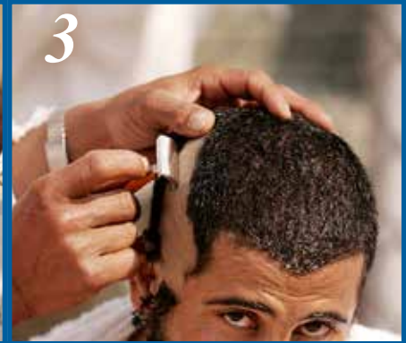
3 சிரைத்தல் அல்லது குறைத்தல்