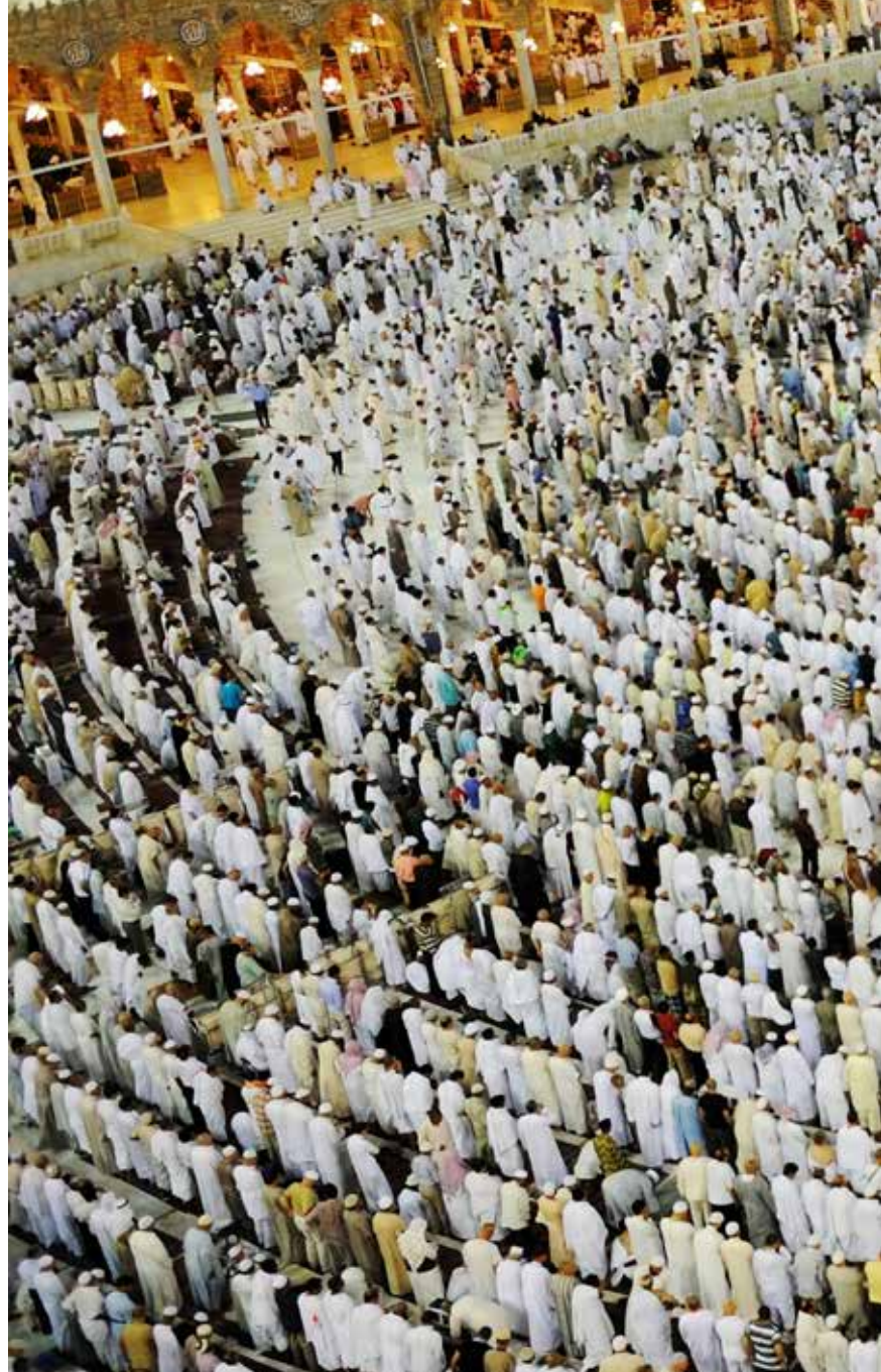
ஸபா மர்வாக்கிடையில் தோங்கோட்டம் ஓடுதல்

13-தோங்கோட்டம் ஓடியதன் பின்னர் தலை தெளிவாக விளங்கும் வரை முடிகளை குறைப்பார். பெண்கள் ஒரு இன்ச் அளவு குறைப்பார்கள். ஆண்கள் சிரைப்பது மிகச்சிகந்ததாகும். அபூ ஹுரைரா ராழி அவர்கள் கூறினார்கள் நபி ஸல் அவர்கள் சொன்னார்கள் «தலையை சிரைப்பவர்களை நீ மன்னிப்பாயாக தோழர்கள் கேட்டார்கள் முடியை குறைப்பவர்கள் சொன்னார்கள் தலையை சிரைப்பவர்களை நீ மன்னிப்பாயாக இவ்வாறு 3 முறை கேட்டதன் பின்னர் சொன்னார்கள் தலையை குறைப்பவர்களை நீ மன்னிப்பாயாக என்று சொன்னார்கள் ». (ஆதாரம் புகாரி) அவர் முதமத்தியாக இருந்தால் உம்ராக்கு பின்னர் ஹஜ் செய்பவர் இவருக்கு நேரம் இருக்கிறது. உம்றாவில் முடியை குறைப்பது ஏற்றமானதாகும். பின்னர் ஹஜ்ஜின் போது தலையை சிரைப்பார்.