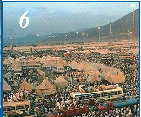
6 மினாவில் தரித்தல்