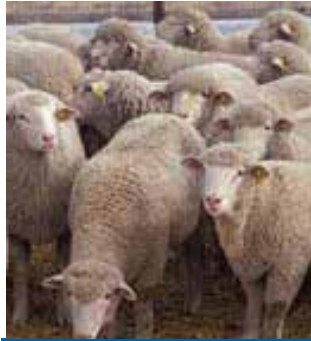
கால்நடைகளை அறுப்பது ஆகுமானது.