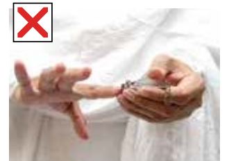
கை நகங்களை வெட்டுதல்