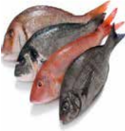
கடலில் உள்ள பிராணிகளை வேட்டையாடுவது இஹ்ராம் அணிந்தவருக்கு அனுமதிக்கப்பட்டுள்ளது.