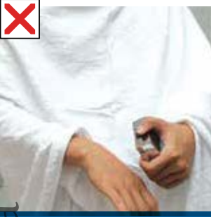
uhKila Mil இ இஹ்ராம் அணிந்த நிலையில் நறுமணம் பூசுதல்