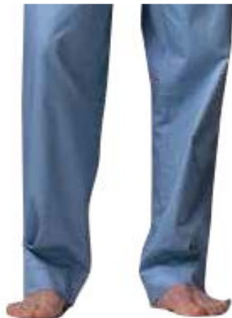
இஹ்ராம் அணிந்தவர் டவ்சர் அணிவது