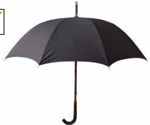
இஹ்ராம் அணிந்த நிலையில் குடை பயன்படுத்தல்