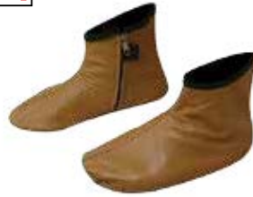
இஹ்ராம் அணிந்தவரின் காலுறை