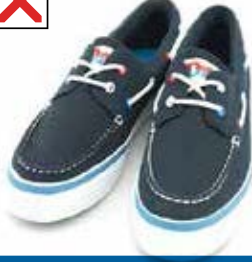
இஹ்ராம் அணிந்தவரின் பாதணி