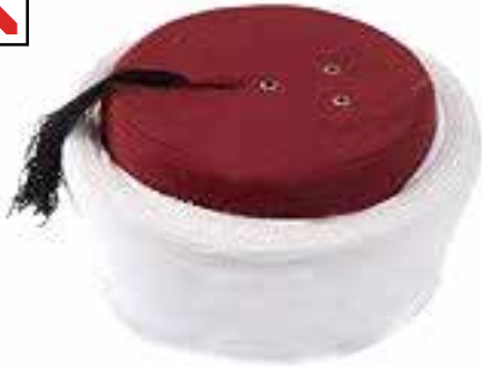
இஹ்ராம் அணிந்தவர் தலைப்பாகை அணிவது