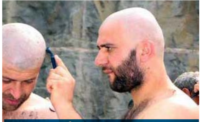
முடியை வெட்டுதல் அல்லது குறைத்தல்

அல்லாஹ் கூறுகிறான் : (உங்கள் தலைமுடிகளைக் களையாதீர்கள்;) (பகரா - 196 ), தடை என்பது தலைமுடியை அடிப்படையாகக் கொண்டு உடம்பில் இருக்கின்ற அனைத்து முடிக்கும் உண்டாகும்.