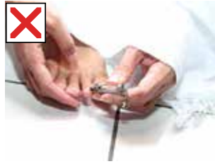
கால் நகங்களை வெட்டுதல்