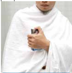
இஹ்ராமுடைய நிலையில் ஆடையில் நறுமணம் பூசுதல்