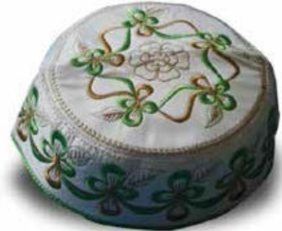
இஹ்ராம் அணிந்தவர் தொப்பி அணிவது