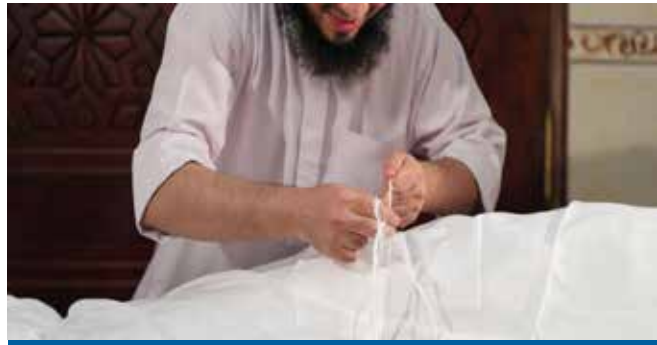
அனைத்து உடலையும் மறைத்தல்.

5- உடலின் அனைத்து பகுதிகளையும் மறைப்பது வாஜிபாகும். துணி இருந்து அவை உடலை மறைக்க போதுமானதாக இல்லாது போனால் அதனை கொண்டு தலையை மறைக்க வேண்டும். காலை இலைகளை (ராகத்தான பூமியில் முளைத்தவைகள்) கொண்டு மறைக்க வேண்டும். முஸ்அப் ரழி அவர்கள் மரணித்த போது நபியவர்கள் «அவரது தலையை மறைக்கும் படியும் அவர்களது காலை இலைகளை கொண்டு காலை மறைக்கும் படியும் ஏவினார்கள்» (ஆதாரம் புஹாரி).