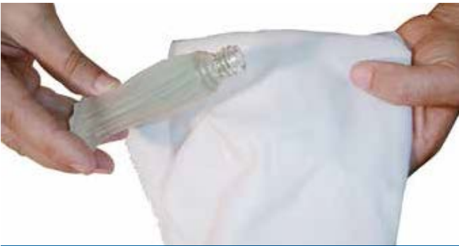
துணிகளில் மணம் பூசுதல்

3- துணிகளை ஒன்றன் மேல் ஒன்றாக வைக்க வேண்டும். அற்றில் கற்பூரம், வாசனைத் திரவம் போன்றவைகளை பூச வேண்டும். இஹ்றாம் கட்டிய ஒருவரானால் அவருக்கு வாசனைகள் எதுவும் பூசம் கூடாது. நபியவர்கள் கூறினார்கள் «அவர்களுக்கு மணம் பூச வேண்டும்» (ஆதாரம் புஹாரி)