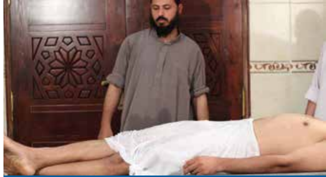
நேர்த்தியாக மையத்தை வைத்தல்

4- மையத்தை நேர்த்தியாக படுக்க வைப்பது அவசியமாகும். வலது புறம் இருந்து இடது புறமாகவும், இடது இருந்து வலமாகவும், அடுத்த அடுத்த பகுதிகளை கபனிட வேண்டும். தலைப்பகுதியில் முடிச்சுக்கள் போட வேண்டும். மையத்தை அடக்கம் செய்யும் போது முடிச்சுக்களை அவிழ்த்து விட வேண்டும்.