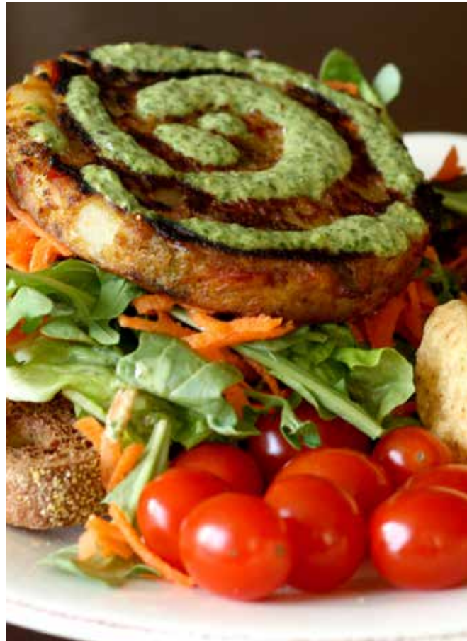
மரணித்தவருக்காக உணவு தயாரித்தல்

1- ஜனாஸாத் தொழுகையை ஒருவர்தவற விட்டால் அவர் அடக்குவதற்கு முன்னரோ அல்லது பின்னரோ தொழுது கொள்ள முடியும். நபியவர்கள் பள்ளியை சுத்தம் செய்யும் பெண் மரணித்த செய்தியை அறிந்த போது அவருடைய கப்றடியே தொழுதார்கள். (ஆதாரம் புஹாரி)