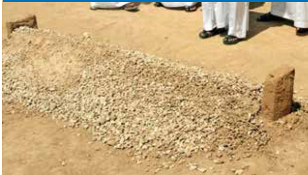
கப்றில் அடையாளம் வைத்தல்.