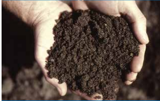
கப்ரில் மண் போடுதல்.