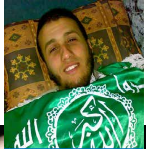
ஷஹீதை அவரது ஆடையுடனே அடக்குதல்

5- ஹஜ் உம்ராவில் இருப்பவர் இஹ்ராம் அணிந்த நிலையில் மரணித்தால் அவரை குளிப்பாட்ட வேண்டும். மணம் பூசக் கூடாது. அவருடைய தலையை மறைக்க கூடாது. அவருக்கு தொழுகை நடத்த வேண்டும். ஹஜ்ஜில் இஹ்ராமோடு மரணித்தவருக்கு நபியவர்கள் கூறினார்கள் «இலந்தை நீரால் அவரை குளிப்பாட்டி, இரண்டு துணியால் கபனிடுங்கள், அவரது தலையை மறைக்க வேண்டாம். அவர் மறுமை நாளில் தல்பியா கூறியவராக வருவார்» (ஆதாரம் புஹாரி)