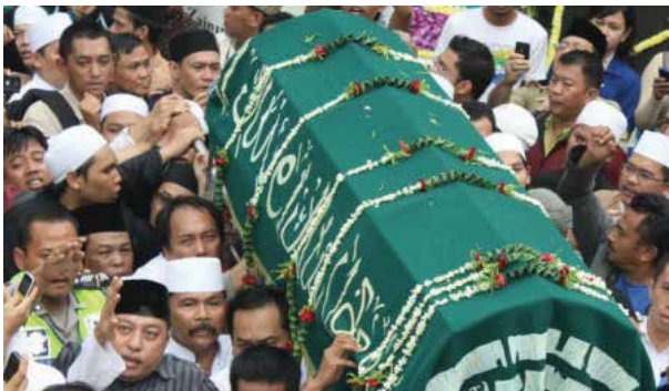
ஜனாஸாவை தூக்குவதில் பங்கேற்றல்