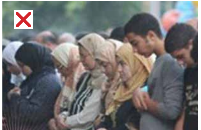
பெண்கள் ஆண்களின் அருகில்