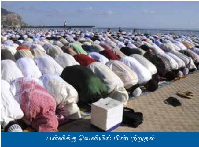
பள்ளிக்கு வெளியில் பின்பற்றுதல்

3- யார் மறதியாக இமாமை முந்துகிறாரோ அவர் இமாமை பின்பற்றி மீண்டு வருவது அவசியமாகும். .