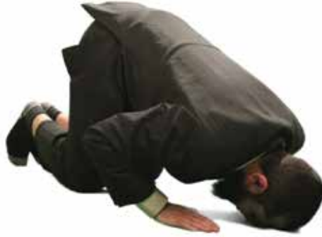
ஸுஜூதும், அதிலுந்து எழும்புதலும்