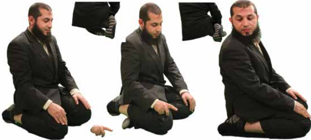
இரண்டுஸு ஸுஜூதிற்கிடையில் அமர்தல்