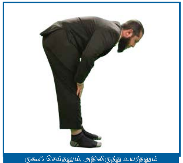
ருகூஃ செய்தலும், அதிலிருந்து உயர்தலும்