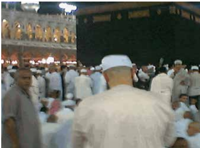
யார் ஹரத்தில் உள்ளே தொழுகிறாரோ

2-பிரயாணியுடைய சுன்னத்தான தொழுகை – முடியுமானவரை தொழுகைக்காக கிப்லாவை முன்னோக்க வேண்டும். அதற்கு இயலாது போனால் பிரயாணத்தின் திசையை நோக்கி தொழ வேண்டும். நபியவர்கள் கூறினார்கள் «பிரயாணத்தின் திசையை நோக்கி சுன்னத்தான தொழுகையை நிறைவேற்ற கூடியவர்களாக இருந்தார்கள். பின்னர் விதர் தொழுவார்கள். வேறு எந்த தொழுகையையும் தொழவில்லை» (ஆதாரம் அபுதாவுத்)