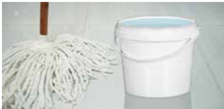
இடத்தை சுத்தம் செய்தல்

அரபியுடைய செய்தியில் அவர் பள்ளியில் சிறுநீர் கழித்த போது நபியவர்கள் கூறினார்கள் «அவரை விடுங்கள் (ஊற்றுங்கள்) சிறுநீர் மீது தண்ணீர் வாளியால் (நீரை நிறப்பக் கூடிய பெரிய வாளி) ஊற்றுங்கள்» (புஹாரி முஸ்லிம்)