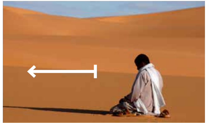
யார் கஃபாவை விட்டும் தூர இடங்களில் தொழுகிறாரோ

கட்டங்களுக்குள் இருப்பவர்கள்ரகில் கிப்லாவை அறியவில்லையனில் அருகில் இருப்பவர்களிடம் கேட்க வேண்டும். அல்லது பள்ளிவாயின் திசை, அல்லது திசைகாட்டிகள், சூரியன், சந்திரன் ஆகியவை மூலம் அறிந்து கொள்ளலாம். அதற்கு சக்தி பெறவில்லையானால் அவருடைய பெரும்பாண்மையான எண்ணத்தை எடுத்துக் கொள்ள வேண்டும். அல்லாஹ் கூறுகிறான். {ஆகவே, உங்களால் இயன்ற வரை அல்லாஹ்வுக்கு அஞ்சி நடந்து கொள்ளுங்கள்}. [தகாபுன்-16]