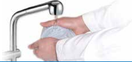
ஆடையை சுத்தம் செய்தல்

அல்லாஹ் கூறுகிறான் {உம் ஆடைகளைத் தூய்மையாக ஆக்கி வைத்துக் கொள்வீராக} [முத்தத்திர் - 04]