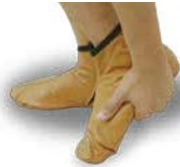
காலுறையின் மேற்பகுதியில் மஸ்ஹ் செய்தல்.