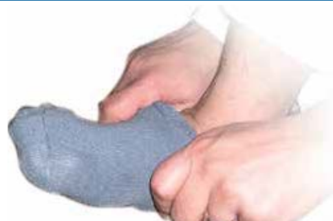
காலுறையை கழட்டுவது மஸ்ஹை முறித்து விடும்.