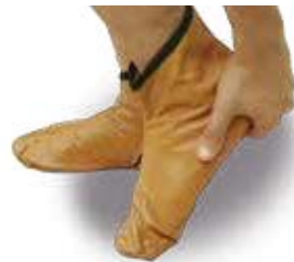
கரண்டையை மஸ்ஹ் செய்தல்