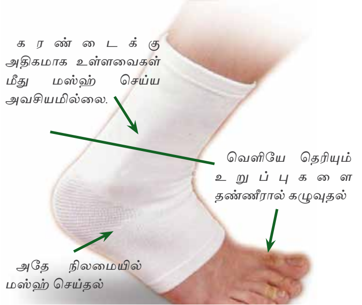
காய கட்டு மீது மஸ்ஹ் செய்யும் முறை

ஒருவர் அவ்வுறுப்பை சுத்தம் செய்ய வேண்டி வந்தால் அதில் அப்பொருள் ஏதாவது இருப்பின் அதனை சூழ உள்ளவற்றை கழுவ வேண்டும். பின்னர் அது பூராகவும் மஸ்ஹ் செய்ய வேண்டும். போடப்பட்டுள்ள கட்டு அல்லது பேன்டேச் உறுப்பை விட்டு தாண்டியதாக இருந்தால் அதனை சுத்தம் செய்வது அவசியமாகும். அதன் மீது மஸ்ஹ் செய்ய தேவையில்லை.