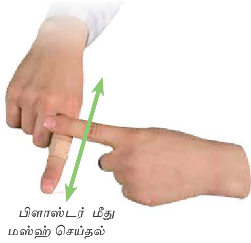
பிளாஸ்டர் மீது மஸ்ஹ் செய்தல்.