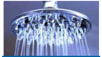
குளிப்பு பெறுந் தொடக்கை சுத்தப்படுத்தக் கூடியது.

குளிப்பைப் ப அவசியமாக்கும் தொடக்கை இது குறிக்கும். உதாரணமாக உடலுறவு கொள்ளல், மாதவிடாய், அதே போன்று வுழுவை முறிக்கும் அனைத்தும் இதனுள் அடங்கும். ஒருவர் மேற்படி காரியங்களில் இருந்து சுத்தமாக வுழு செய்ய வேண்டும். : {நீங்கள் பெருந்தொடக்குடையோராக (குளிக்கக் கடமைப்பட்டோராக) இருந்தால் குளித்துத் தேகம் முழுவதையும் சுத்தம் செய்துக் கொள்ளுங்கள்; உங்களுக்குத் தண்ணீர் கிடைக்காவிட்டால் (தயம்மும் செய்து கொள்ளுங்கள்; அதாவது) சுத்தமான மண்ணைக் (கையினால் தடவிக்) கொண்டு அவைகளால் உங்கள் முகங்களையும், உங்களுடைய கைகளையும் தடவிக் கொள்ளுங்கள்}. [மாயிதா - 06].