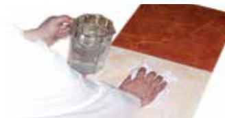
இடத்தை சுத்தம் செய்தல்