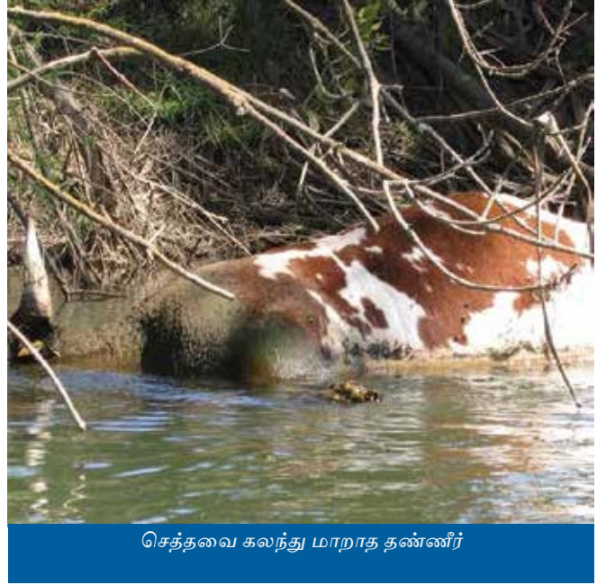
செத்தவை கலந்து மாறாத தண்ணீர்