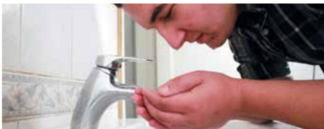
வுழு சிறு தொடக்கை சுத்தப்படுத்தக் கூடியது.