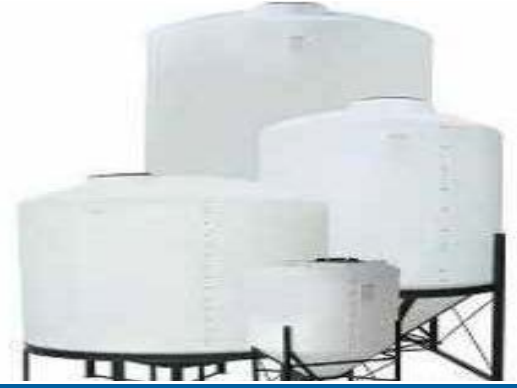
நீர் தொட்டியில் உள்ள தூசி