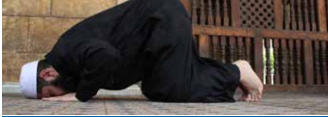
தொழுகையை தடுக்க கூடிய தொடக்கு

இது தொடக்குகளிலிருந்தும், நஜீஸ்களிலிருந்தும் உடலை சுத்தமாக்குதலை குறிக்கின்றது. மேலும் இது இரண்டு வகைப்படும்.