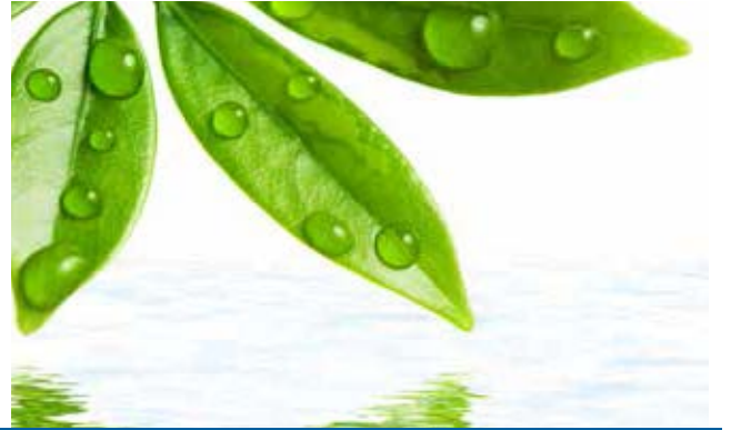
இலை கலந்த நீர்