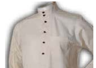
ஆடையை சுத்தம் செய்தல்