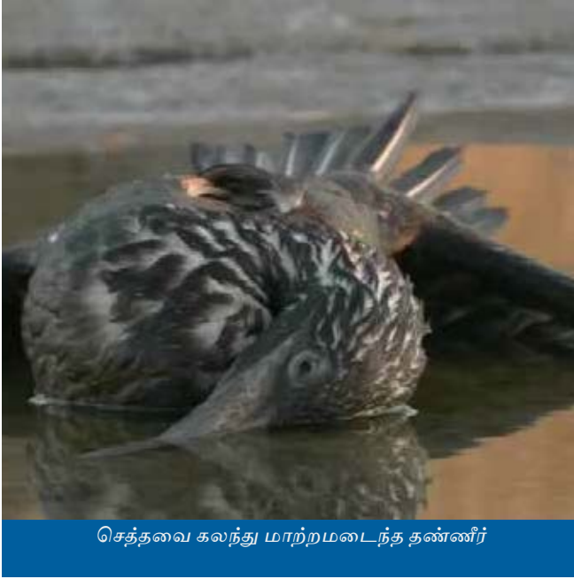
செத்தவை கலந்து மாற்றமடைந்த தண்ணீர்