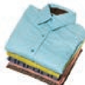
надевание сшитой одежды