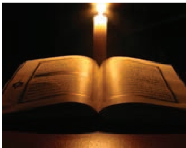
(2) Абу Дауд.