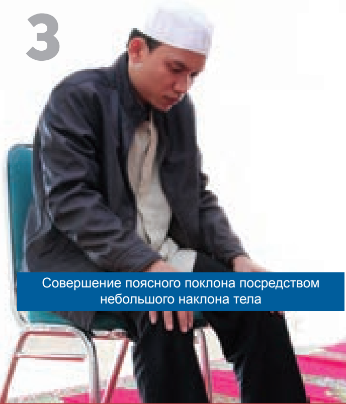
Совершение поясного поклона посредством небольшого наклона тела