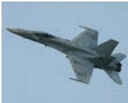
Совершение молитвы в самолете