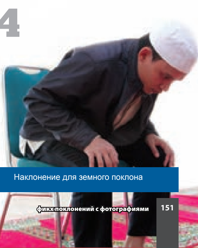
Наклонение для земного поклона