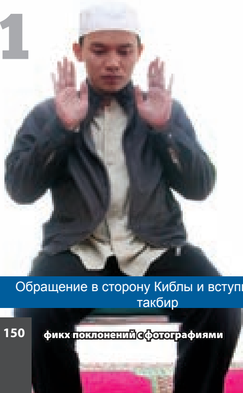
Обращение в сторону Киблы и вступительный такбир