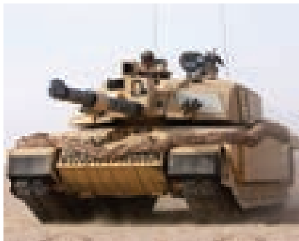
Совершение молитвы в танке