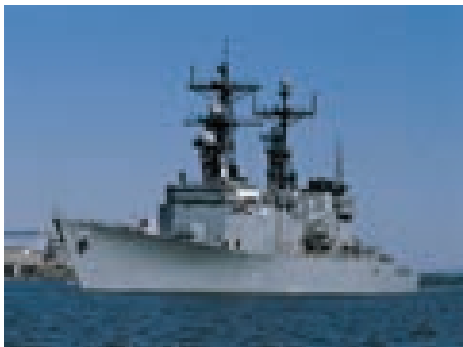
Совершение молитвы на корабле