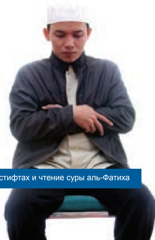
Дуа аль-истифтах и чтение суры аль-Фатиха