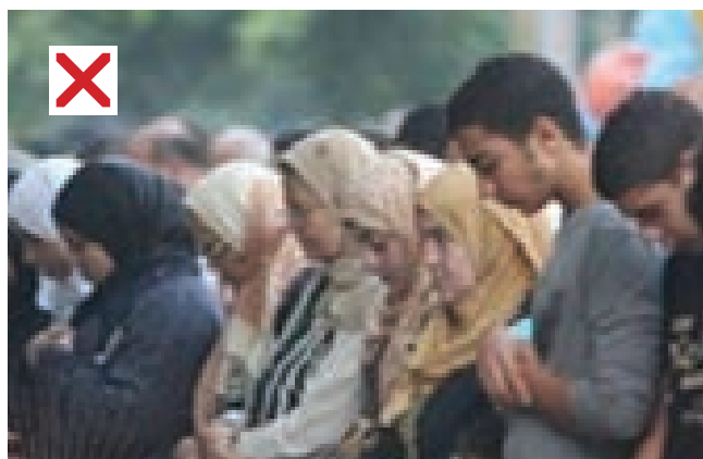
Женщина поблизости от мужчин