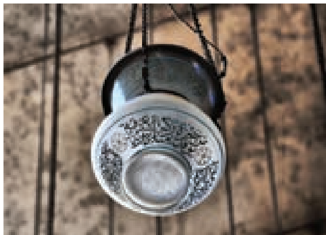
(1) Абу Дауд. (2) Ахмад.