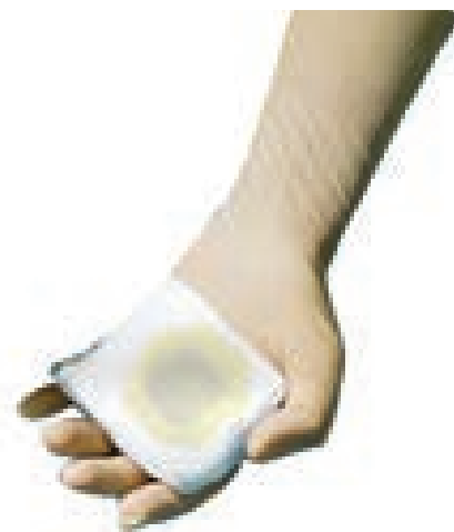
Желтый цвет крови