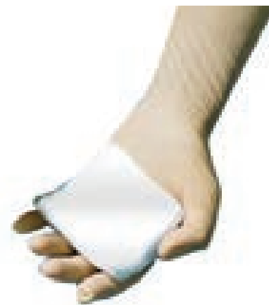
Указывает на состояние очищения