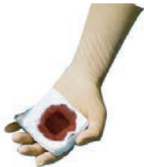
Темный цвет крови