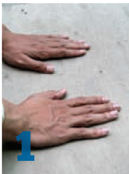
Ударить ладонями по песку