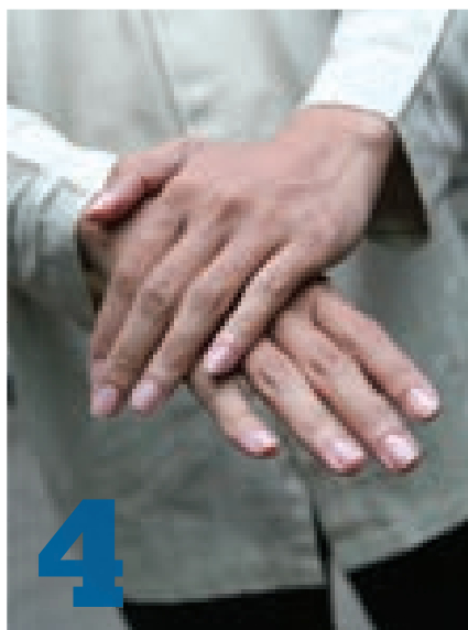
Протереть правую руку левой