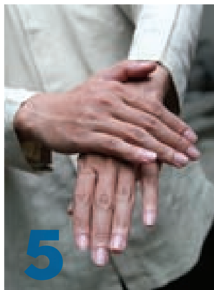
Протереть левую руку правой