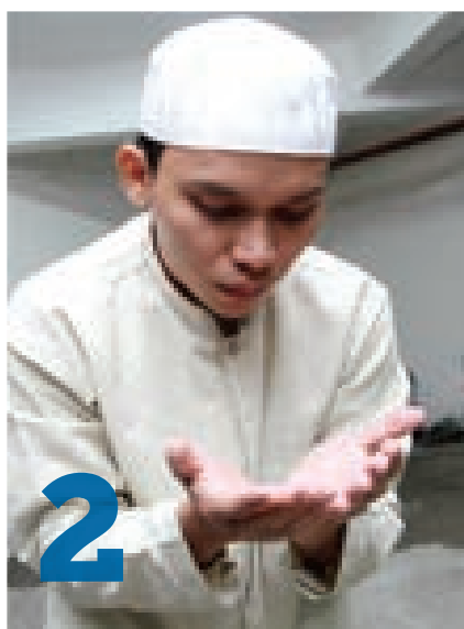
Отряхнуть ладони от песка