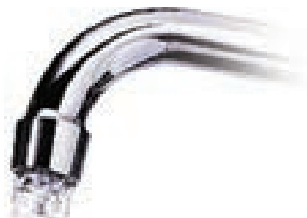
когда нет воды