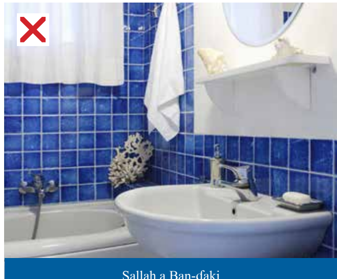
Sallah a Ban-ɗaki

Al'aurar Mace a sallah : ita ce dukkan jikinta ban da fuskarta da tafukanta.