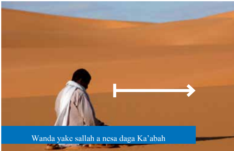
Wanda yake sallah a nesa daga Ka'abah