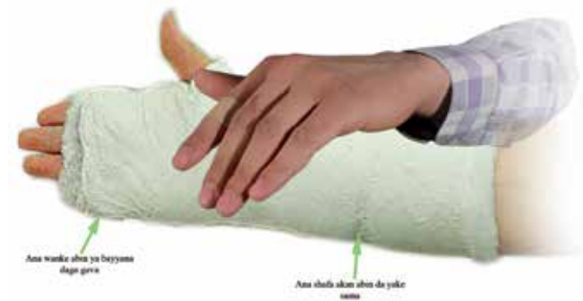
Shafa a kan karan-dori