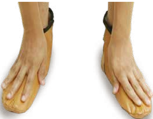
Shafa da hannaye biyu