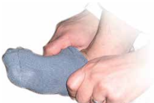
Tube safa yana bata shafar