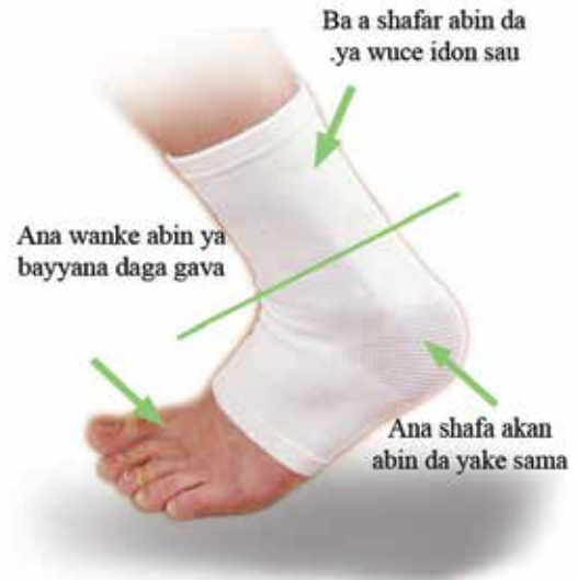
Yadda ake shafa akan bandeji

Misali : Mutum ne aka sa masa bandeji a kan kafarsa har zuwa kwaurinsa, to zai shafi kan kafarsa ne, ba zai shafi kwaurinsa ba.