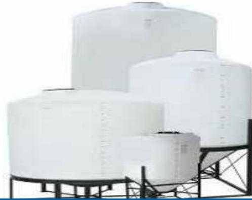
Tsatsar tankunan ruwa

Saboda abin da Manzon Allah (ﷺ) ya faɗa wa matan da suke shirya 'yarsa wadda ta mutu, ya ce musu: « Ku wanketa da ruwa da magarya sau uku, ko biyar, ko fiye da haka in akwai buƙata Magarya: A nan ana nufin ganyen bishiyar magarya. ana dandaƙa shi a yi amfani da shi wajen tsafacce abubuwaKu sanya Kafur a wanki na ƙarshe » (Bukhari da Muslim ne suka rawaito shi).