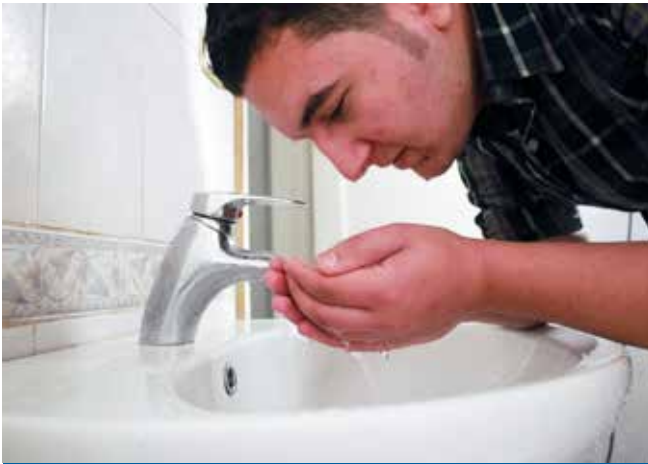
Alwala tsarki ce daga karamin kari