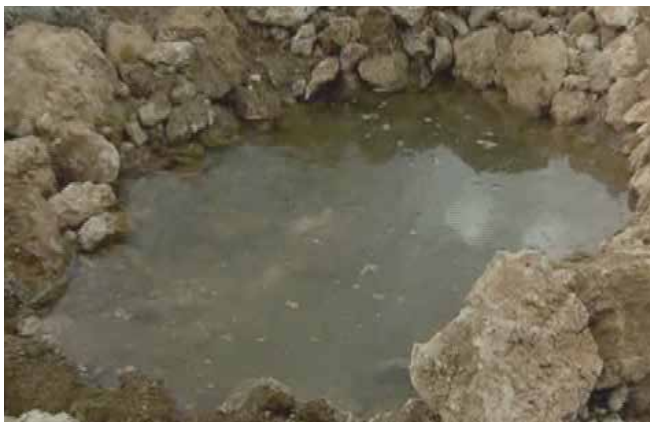
Ruwa da ya haɗu da kasa