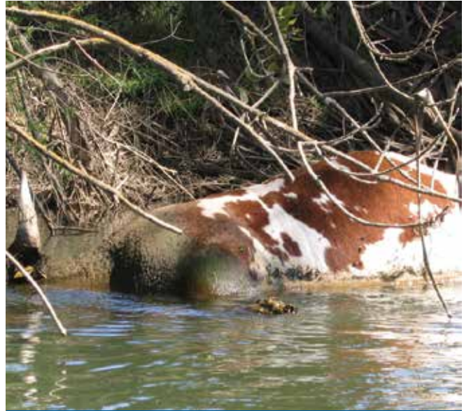
Mushe ya fadfa ruwa bai canza shi ba