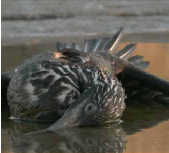
Mushe wanda ya canza ruwa