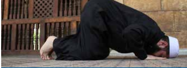
Kari yana hana yin sallah.

Kari shi ne : Abin da yake hana mutum yin ibadar da aka shardanta tsarki a cikinta, kamar sallah, dawafi da waninsu. Kari ya kasu kashi biyu :