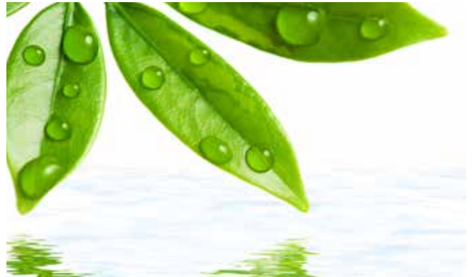
Ruwan da ya gauraya da ganyen bishiya