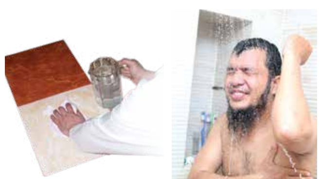
Tsarkin wurin sallah

Gusar da najasa wajibi ne, saboda fadin Allah Madaukakin Sarki {Ka tsarkake tufafinka} [Al-Muddassir 4]. Da fadin Manzon Allah (ﷻ) «Mafi yawancin azabar kabari daga rashin yin tsarki ne idan an yi fitsari» Da fadinsa (ﷻ) «Idan dayanku ya zo masallaci to ya duba takalmansa, idan ya ga kazanta ko najasa to ya goge, sannan ya yi sallah da su».