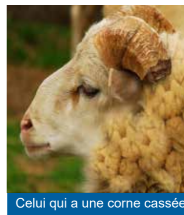
Celui qui a une corne cassée