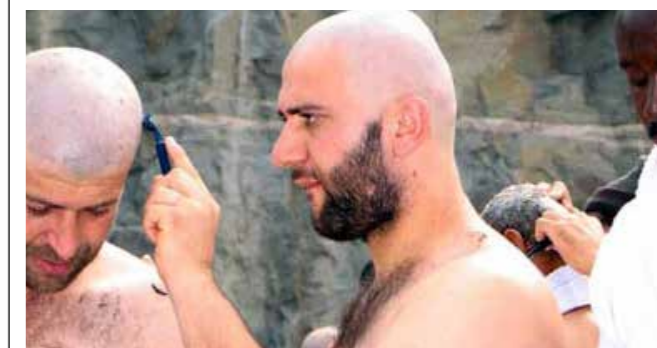
Le rasage et le raccourcissement des cheveux