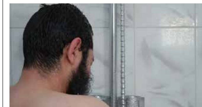
Le bain rituel