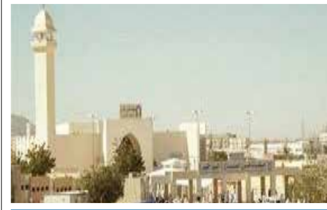
Qarn Al Manazil

Et c'est le lieu de sacralisation des gens du Najd et de Taif, et plus haut, sur la route de Taif, du côté d'Al Hada, il y a un endroit qui s'appelle: Wadi Mahram, et chacun des deux endroits est considéré comme lieu de sacralisation pour les gens du Najd, et de celui qui vient par la route de Taif.