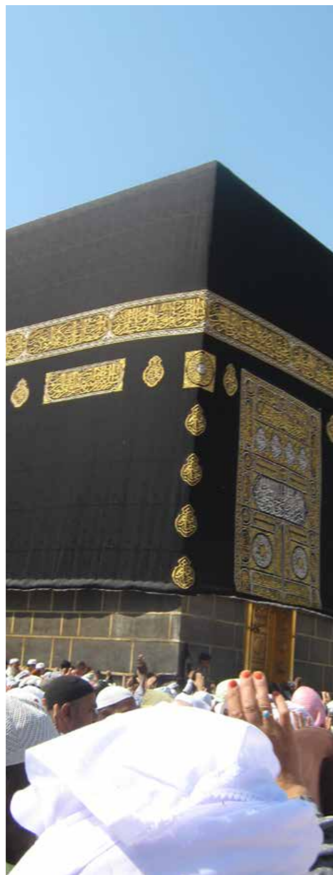
Al mawaqit (lieux et périodes de sacralisation rituelle)

B – La période de sacralisation concernant l’Omra: toute l’année.