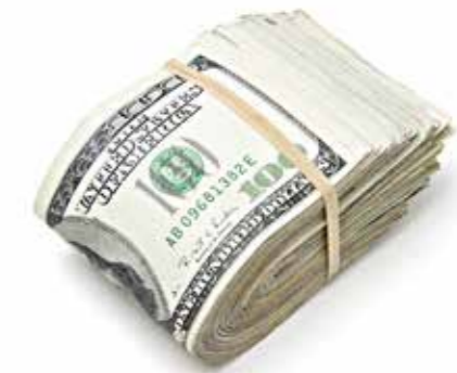
Les billets de banque

Exemple: si la valeur d'un gramme d'or correspond à 30 dollars, alors l'aumône légiférée (zakât) est obligatoire pour celui qui possède ( 30 \times 85 = ) 2550 dollars [ou plus].