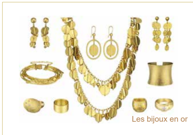
Les bijoux en or