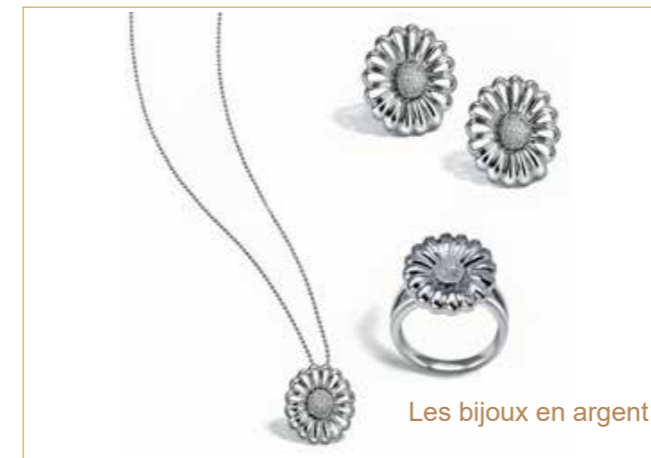
Les bijoux en argent

L'on retiendra toutefois que la prudence veut que son acquiescement soit réalisé pour les bijoux destinés à une utilisation classique et à l'embellissement ; car cet avis est plus apaisant et laisse la conscience tranquille ; Et comme l'a dit le Prophète, paix et salut sur lui: «Délaisse ce qui te fait douter pour ce qui ne te fait pas douter». (Rapporté par Al Boukhari)