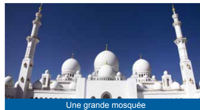
Une grande mosquée

Il faut que la mosquée soit une Mosquée où est accomplie la prière du vendredi, et dans laquelle la plupart des gens de la ville se réunissent sans qu'elle ne soit spécifique à un groupe de gens d'une région précise.