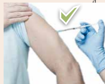
L'injection de pénicilline ne rompt pas le jeûne

Selon Abi Hourayrah, qu'Allah soit satisfait de lui: «Un homme vint trouver le Prophète, paix et bénédiction d'Allah sur lui, en lui disant: «J'ai péri, ô Messager de Dieu !» «Qu'as-tu fais ?» lui demanda le Prophète. Il dit : «J'ai eu un rapport sexuel avec ma femme pendant le mois de Ramadân». Le Prophète lui dit alors: «As-tu les moyens d'affranchir un esclave ?» «Non», répondit l'homme. Le Prophète dit alors: «As-tu la capacité de jeûner deux mois consécutifs ?» «Non»,