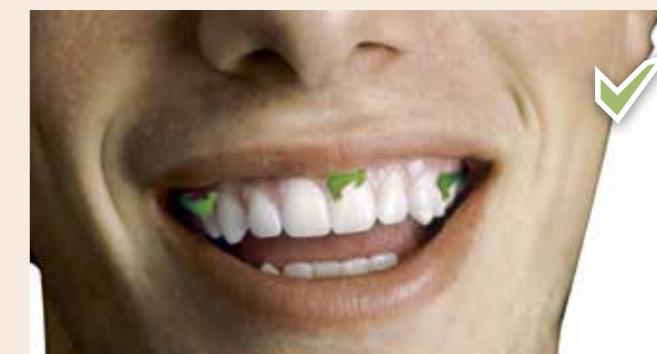
Les restes de nourriture dans les dents ne rompent pas le jeûne [tant qu'ils sont avalés de manière non intentionnelle].