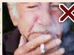
Les cigarettes rompent le jeûne