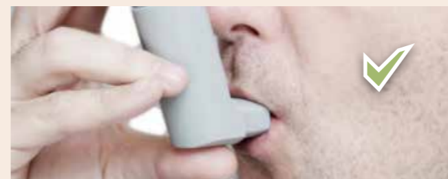
Le pulvérisateur de Cortisone ne rompt pas le jeûne [tant que rien n'est avalé et atteint l'estomac]

répondit-il une nouvelle fois. Le Prophète poursuivit: «As-tu les moyens de nourrir soixante pauvres ?» «Non». Il lui dit alors : «Assieds-toi» et c'est ce qu'il fit. Le Prophète, paix et bénédiction de Dieu sur lui, apporta alors un panier de dattes et dit à l'homme: «Distribue ceci aux pauvres» L'homme dit: «A des plus pauvres que nous ? Il n'y a aucune famille dans cette ville ayant plus besoin de ce panier de dattes que nous !» Le Prophète, paix et bénédiction de Dieu sur lui, rit alors jusqu'à ce que ses molaires se découvrirent, puis il dit: «Nourris-en ta famille.»