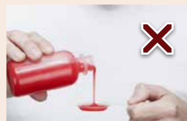
Les médicaments nourrissants rompent le jeûne