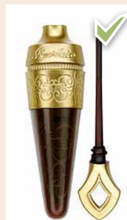
Le Kohl ne rompt pas le jeûne

La femme aussi doit expier son acte si elle suit l'homme dans son désir. En revanche, s'il la force à avoir ce rapport sexuel, alors elle doit refaire le jeûne, pour ce jour uniquement, sans expiations.