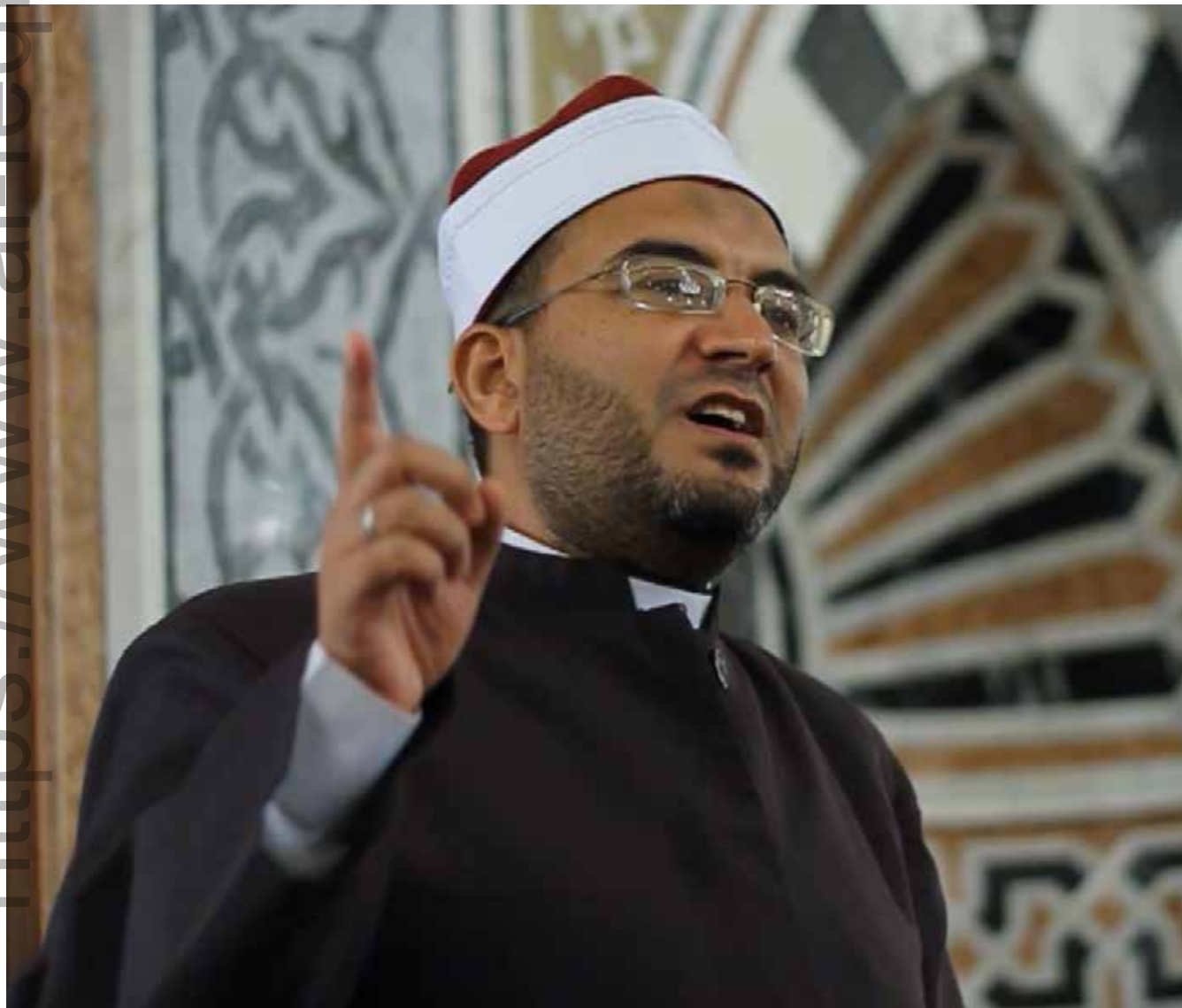
Il pointe du doigt avec son index

En effet, Iyaas Bin Abii Ramlah Al Chaamy a