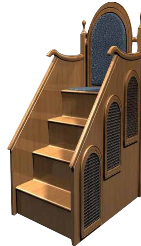
Chaire à trois marches

5. Il n'y a pas de prière recommandée avant la prière du vendredi, mais il est préférable de faire des prières surrogatoires générales avant l'appel à la prière. En effet, le Prophète, Paix et Salutations d'Allah sur lui a dit: «Il n'y a pas un homme qui prenne un bain rituel le jour du vendredi, et qui se purifie du mieux qu'il le peut, puis oint son corps de son huile, ou se parfume du parfum de sa maison, puis sort (pour la prière du vendredi), en ne séparant pas deux individus entre eux, puis prie ce qu'Allah lui a ordonné de prier, et écoute attentivement l'imam lorsqu'il parle, sans que ne lui soit pardonné ce qu'il y a entre ce vendredi et le suivant» (Rapporté par Ad Daarimy).