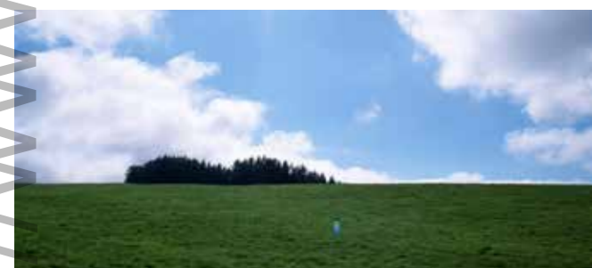
Le moment de la prière du vendredi