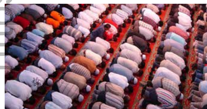
Elle se fait en groupe