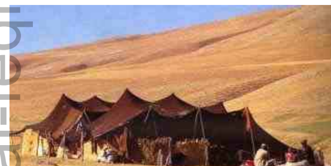
La prière du vendredi ne peut pas être accomplie par les bédouins dans leurs habitations

4. Qu'elle soit précédée par deux sermons, parce que le Prophète, Paix et Salutations d'Allah sur lui, a toujours agi ainsi.