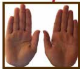
Les deux paumes