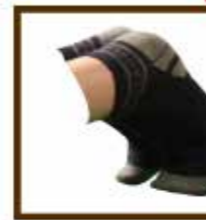
Les deux pieds