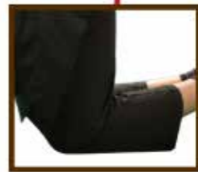
Les deux genoux