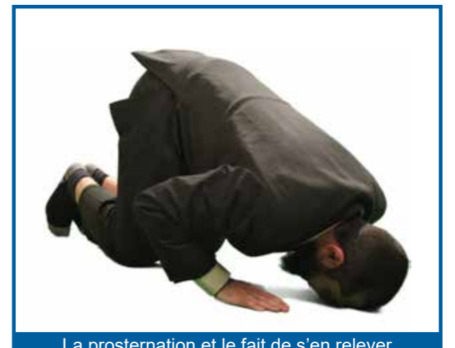
La prosternation et le fait de s’en relever par la suite