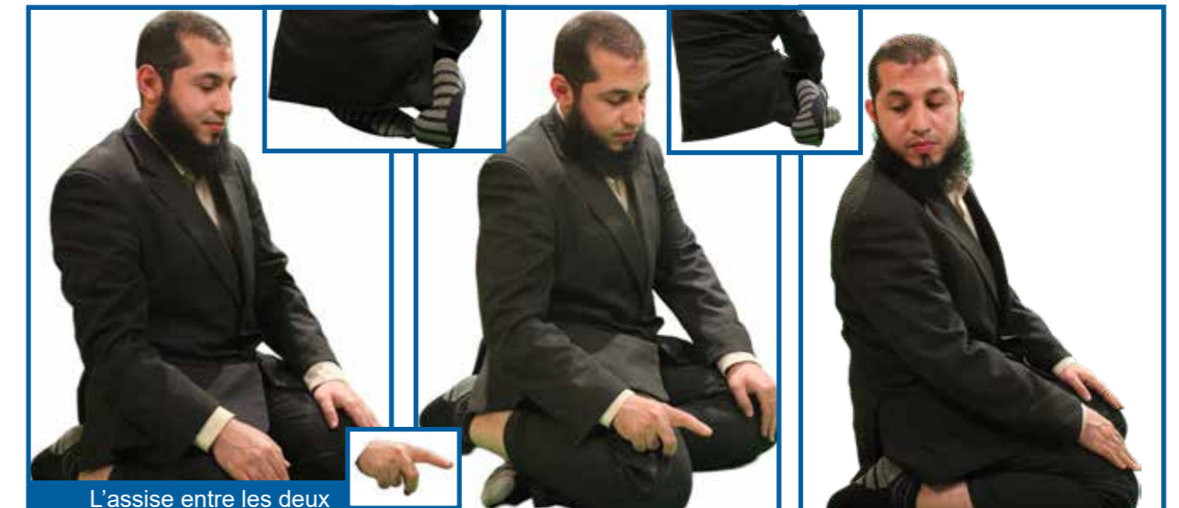
L’assise entre les deux prosternations