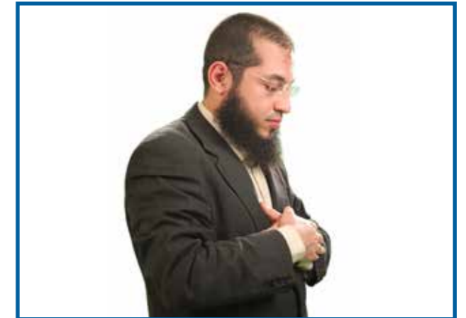
La lecture de la Sourate de l’Ouverture (Al Fatiha)