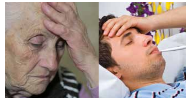
La personne âgée

Comme pour le malade, la personne âgée qui ne peut pas se déplacer et qui n'a personne pour l'aider à faire ses ablutions.