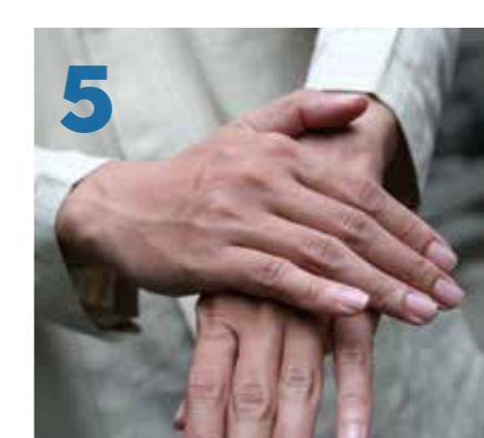
5 Passer sa main droite sur sa main gauche