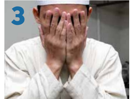
3 L'essuyage du visage