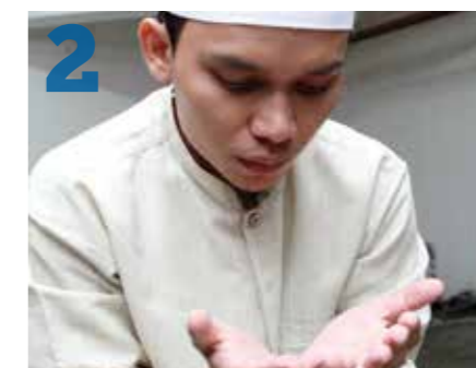
2 Souffler sur ses mains afin de diminuer la quantité de poussière qui les recouvre