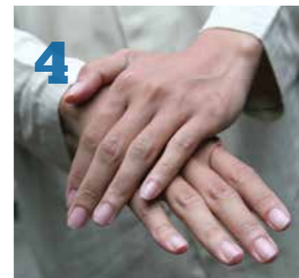
4 Passer sa main gauche sur sa main droite