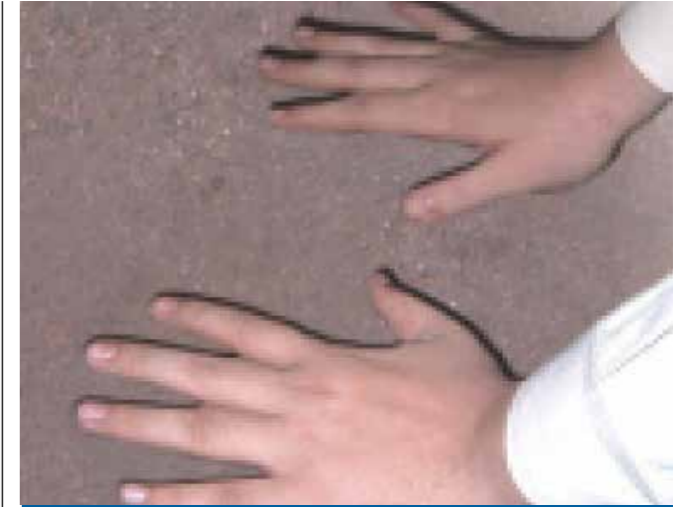
Celui qui ne trouve pas d'eau

Il a été prouvé scientifiquement que la terre du sol contient entre les atomes qui la composent une matière purificatrice. Cette matière peut tuer des germes en tout genre, mais également des microbes et des virus.