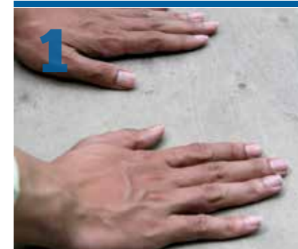
1 Frapper la terre avec ses mains