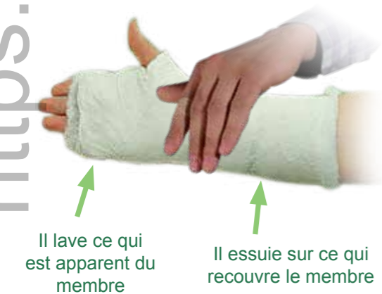
L'essuyage sur le plâtre