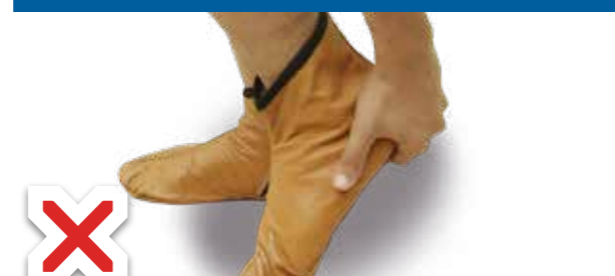
L'essuyage du talon