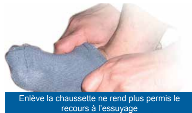
Enlève la chaussette ne rend plus permis le recours à l'essuyage

Ainsi, il est demandé à celui qui porte des chaussettes de les retirer au plus vite dès qu'il décèle une mauvaise odeur et de les laver, ainsi que ses pieds et ce, afin de ne pas porter préjudice à ses frères musulmans.