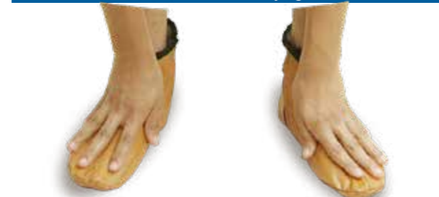
L'essuyage avec les deux mains