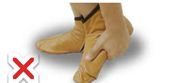
Passer sa main en dessous de la bottine