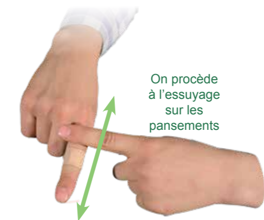
Méthode d'essuyage sur les pansements