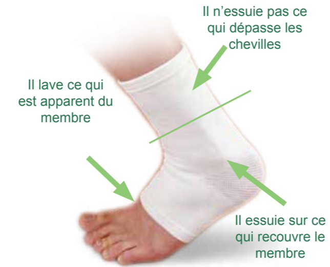
La manière d'essuyer sur le bandage