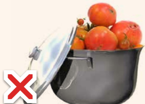
Manger dans un récipient en argent