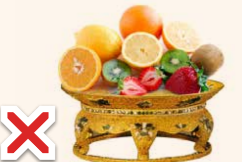
Manger dans un récipient en or

L'utilisation des récipients en or et en argent pour autre chose que la nourriture et les boissons