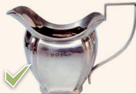
Le seau en argent pour les ablutions

Il est interdit de les utiliser, comme l'a dit le Prophète, Paix et Salut d'Allah sur lui: «Et ne buvez pas dans les récipients en or et en argent et ne manger pas dans des assiettes en or et en argent, car ils sont pour eux dans la vie d'ici-bas et pour nous dans la vie de l'au-delà» (Authentifié par Al Boukhari et Mouslim.). Il a également dit, Paix et Salut d'Allah sur lui, dans un autre hadith: «Celui qui boit dans des récipients en argent, c'est comme s'il ingurgitait dans son ventre le feu de l'enfer» (Authentifié par Al Boukhari et Mouslim.).