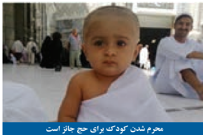
محرم شدن کودک برای حج جائز است

پس بر کودک واجب نیست، و اگر احرام به حج بست، حشش درست است، ولی از حج اسلام که فرض است کفایت نمیکند، بلکه حج نفلی برایش میباشد، بدلیل حدیث ابن عباس رضی الله عنه که زنی کودکی را به رسول الله صلی الله علیه و آله بلند کرد و گفت: آیا برای این حج است؟ فرمودند: (( آری، و برای تو نیز اجر است)) (۲)