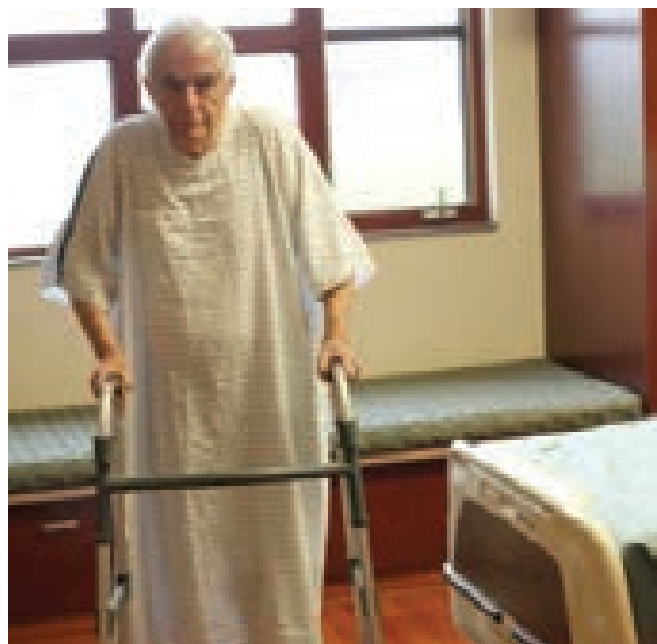
مردی ناتوان از حج

کسیکه از حج کردن ناتوان باشد، به علت سالخوردگی، و یا بیماریکه امید شفا یافتن از آن نیست، و یا به سبب ضعفی بدنی طوریکه توان سوارشدن و سائل سفر را ندارد، بر وی لازم است که برای حج و عمره کردن کسی را از جانب خود نائب بگیرد، اگر بعد از احرام نمودن نائبش به حج و یا عمره شفا یافت، از وی کافی است، از الفضل بن عباس رضی الله عنه روایت است که زنی از خثعم گفت: ((ای رسول الله، بر پدرم فریضه حج الله است، در حالیکه بسیار سالخورده است، نمیتواند بر پشت شتر قرار گیرد، فرمودند: بعوض او حج بکن)) (۸)