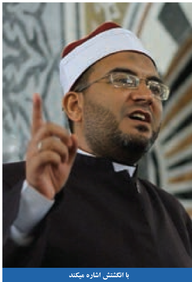
با انگشتش اشاره میکند

شده که گفت: (رسول الله صلی الله علیه و آله را دیدم که خطبه میداد هنگامیکه دعاء میکرد این چنین میگفت - با انگشت سبابه اش اشاره میکرد). (۱)