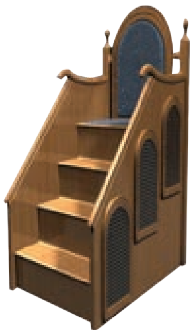
منبر دارای سه پلکان باشد