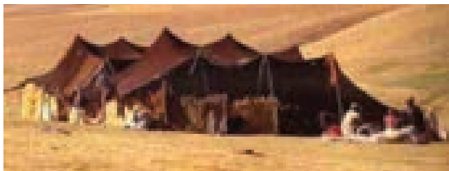
نماز جمعه خواندن در جاهای بودوباش بادیه نشینان صحیح نیست

زیست کنند، و در تابستان و زمستان از آن کوچ نمیکنند، اما بادیه نشینان، و خیمه نشینان کوچی، نماز جمعه شان درست نیست، و بر آنان واجب نیست. ۴. باید پیش از نماز دو خطبه خوانده شود: بدلیل مواظبت نبی اکرم ﷺ بر آن.