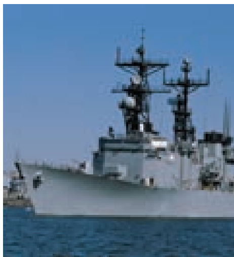
در کشتی نماز میخواند