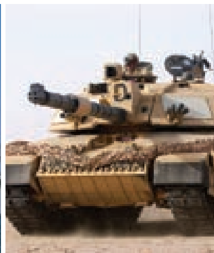
در تانک نماز میخواند