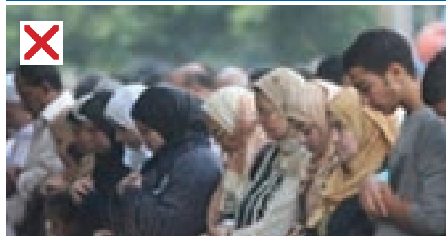
زن در کنار مردان