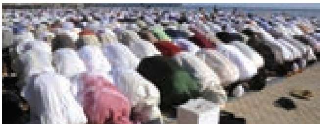
اقتداء در خارج مسجد