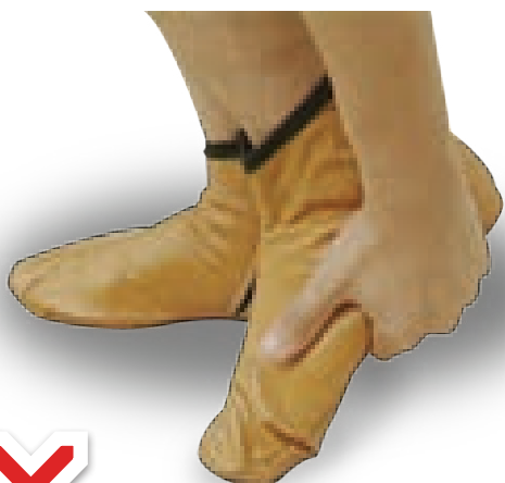
مسح کف موزه

های خود مسح کنیم، و آنها را از بی وضوء شدن بعلت بول وغائط وخواب از پا نکشیم، مگر اینکه جنابت رخ داده باشد (۱) . باین معنی که جنب باید موزه ها برای غسل کردن بکشد، و سپس بار دیگر آنها را به پا کند.