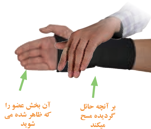
چگونگی مسح بر جیره

پایش رسیده است، در چنین وضعی بر آن بخشی که باید میشست مسح کند و بر بخش دیگرش که در ساق پایش قرار دارد، مسح نمیکند.