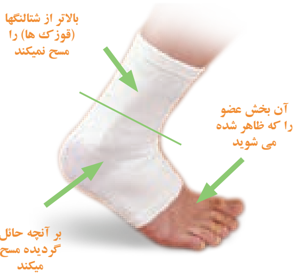
چگونگی مسح بر عصابه