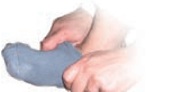
کشیدن جوراب مسح را میسکند.