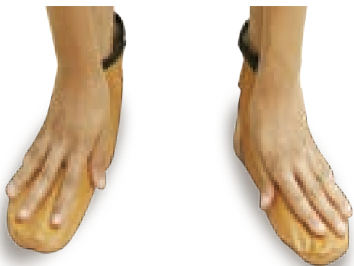
مسح با دو دست