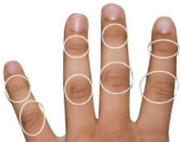
مفاصل پنجه های پشت دست

برخی از علما چرکهای گوش و گردن و سایر اجزای بدن را نیز به آن ملحق کرده اند