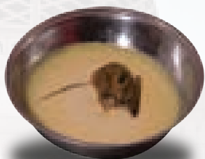
روغن زردیکه در آن موش مرده افتاده

اگر به دنباله جامه زن پلیدی چسبید، برای پاکی آن حرکت در جای پاک کفایت میکند، زیرا زمین پاکش می کند، به دلیل فرموده آنحضرت ﷺ : " ما بعد آن پاکش میکند" (۱)