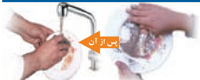
پاک کردن با شستن