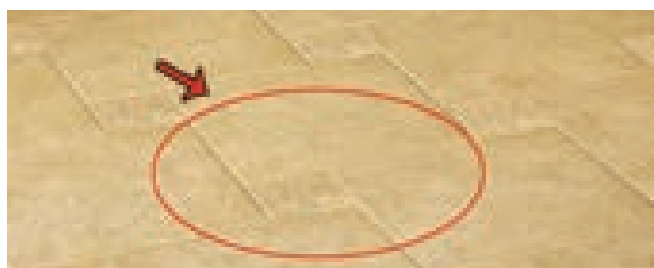
خشک شدن نجاست مایع