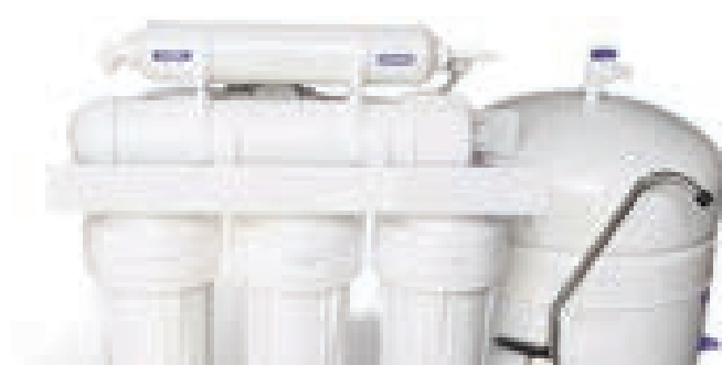
پاک سازی با وسائل مدرن