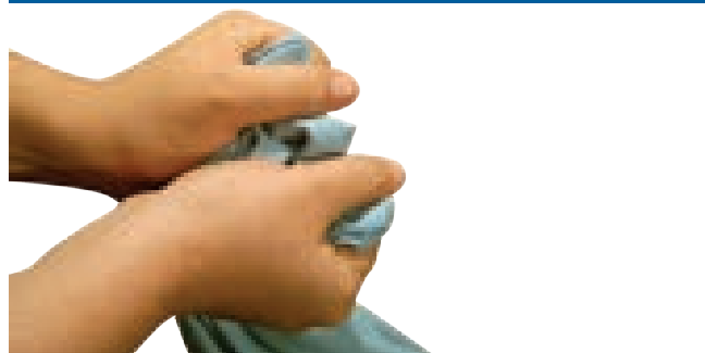
مالیدن اگر خشک باشد