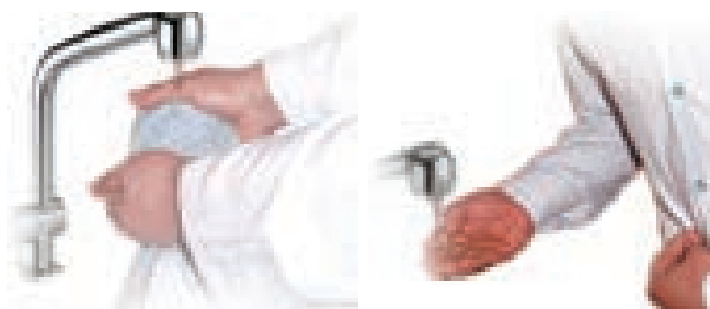
ادار دختر شیرخوار شسته میشود

بول دختر شیرخوار شسته میشود، واما بول پسر شیرخوار به آن آب پاشیده میشود، به دلیل فرموده آنحضرت ﷺ: "بول دختر شیرخوار شسته میشود، واما بول پسر شیرخوار به آن آب پاشیده میشود." (۱)