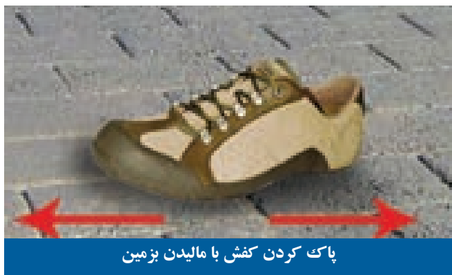
پاک کردن کفش با مالیدن بزمین

بزمین مالیده میشود تا آثار نجاست از آن برود، به دلیل فرموده آنحضرت ﷺ: "هرگاه یکی از شما با کفش خود پلیدی رازیر پا کرد، مالیدن بخاک برایش پاکی است." (۶)