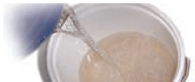
پاک سازی با افزایش آب

با افزودن آب بیشتر به آن تا اینکه آثار نجاست زائل گردد پاک میشود، همچنین با بکاربری وسایل تکنولوژی مدرن نیز پاک میشود.