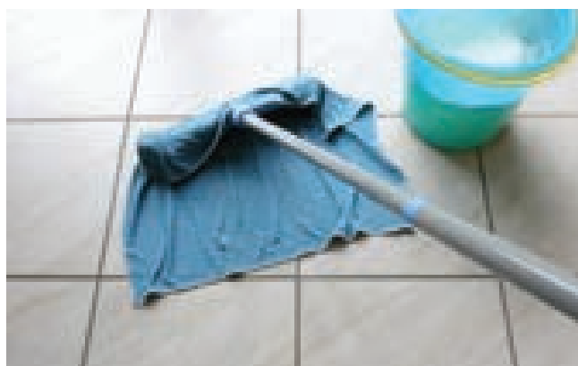
شستن زمین با آب