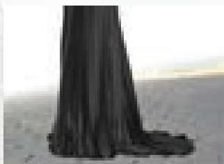
پاک کردن جامه زنان