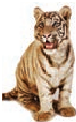
حیوانیکه گوشتش خورده نمیشود

چنین پوستی حکم خودمرده را که نجاست است دارد وحتا اگر حیوان به شیوه شرعی ذبح شود نیز پاک نمیگردد.