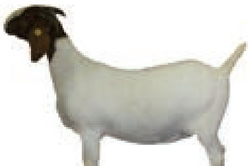
حیوانیکه گوشتش خورده میشود