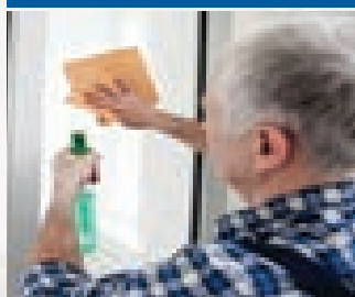
پاک کردن آئینه با مسح کردن

۱۳- پاک کردن مسطح های صیقل شده، مانند آئینه و شیشه پاک کرده شود تا آثار پلیدی از آن زائل گردد.