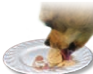
آب دهن سگ

ولوغ: ادخال سگ زبانش در ظرف و حرکت دادنش را گویند، چه بنوشد یا نه.