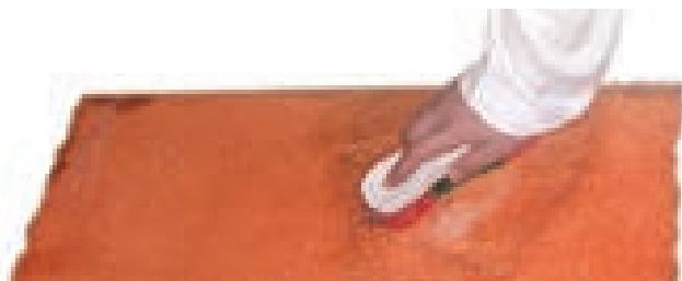
پاک کردن فرش

با آب و یا منظفات مدرن شسته شده و مالش داده میشود تا نجاستش زائل گردد.