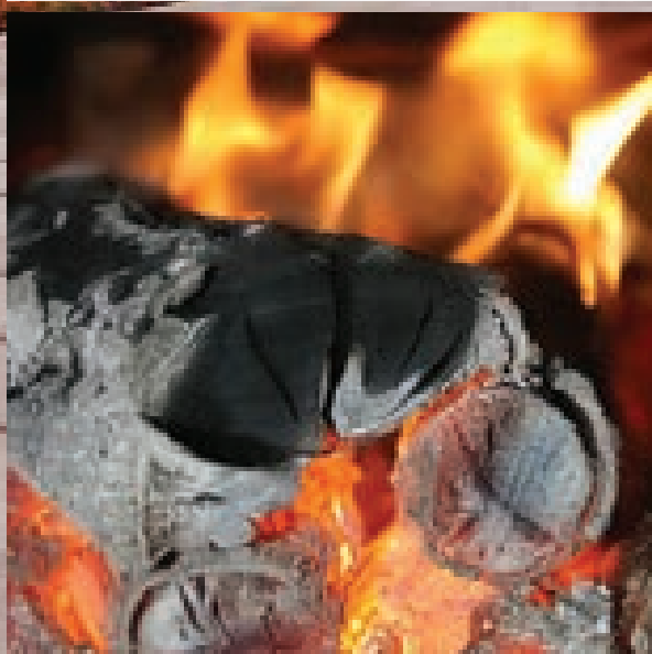
مبدل شدن نجاستی به خاکستر پاکش میکند