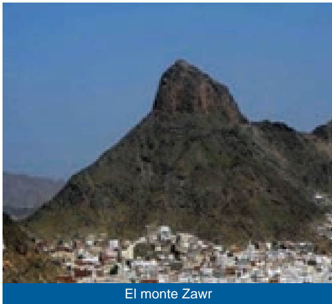
El monte Zawr