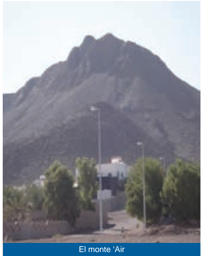
El monte ‘Air