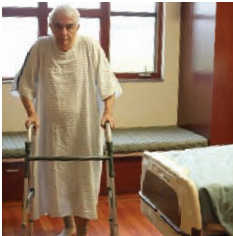
Hombre impedido de peregrinar

Quien represente a alguien en el Hayy debe cumplir los siguientes requisitos: