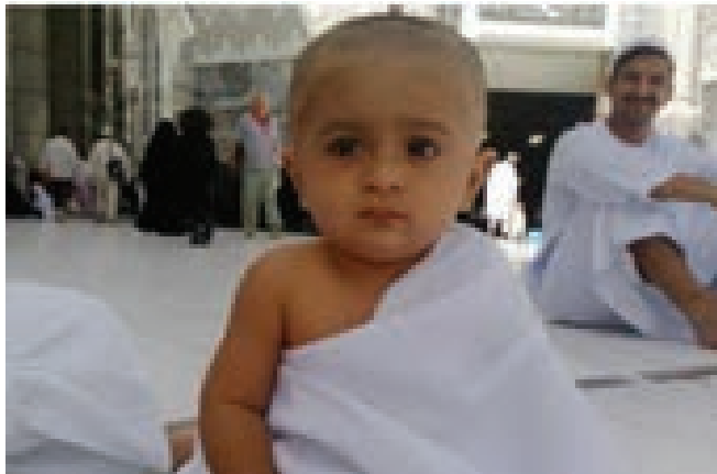
Es lícito que el menor se consagre para el Hayy

No es obligación del menor; sin embargo, si se consagra para el Hayy este le será válido, pero no como el Hayy obligatorio del Islam sino como nafl. Ibn 'Abbas, Al-lah esté complacido con él, relató que una mujer levantó un niño ante el Mensajero de Al-lah, la paz y las bendiciones de Al-lah sean con él, y le dijo: “¿Este hace el Hayy?” Y él le respondió: “Sí, y tú tienes recompensa” (2) .