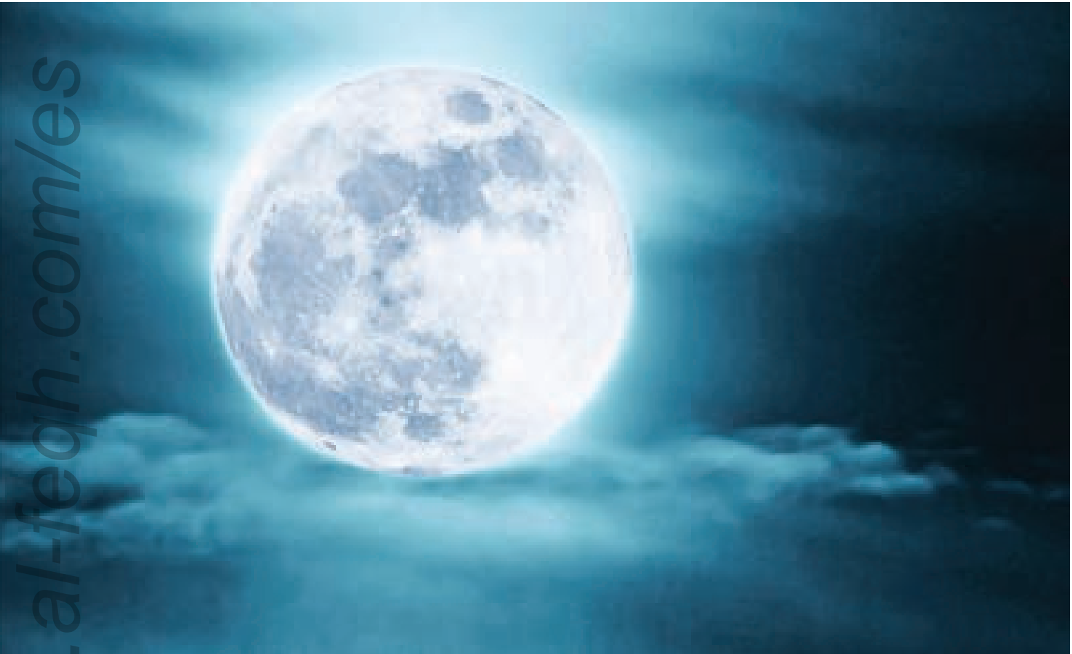
Gráfico que muestra un eclipse lunar completo.