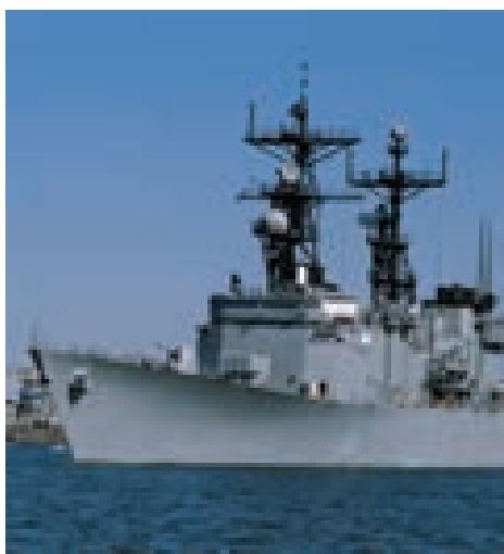
Rezando en el barco de guerra