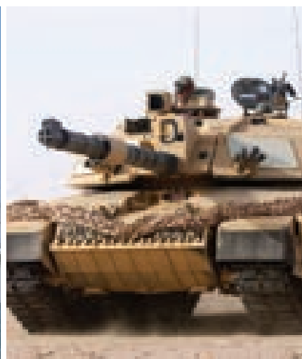
Rezando en el tanque de combate