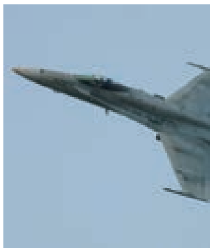
Rezando en el avión de combate