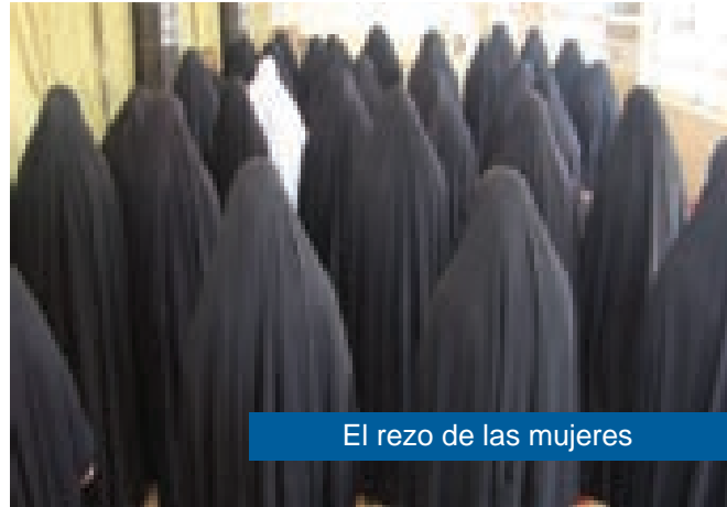
El rezo de las mujeres

los hombres y que sean iguales que las de los hombres. Abu Huraira, Al-lah esté complacido con él, dijo que el Mensajero de Al-lah, la paz y las bendiciones de Al-lah sean con él, dijo: “las mejores filas de las mujeres son las de atrás y las peores son las de adelante” (5) .