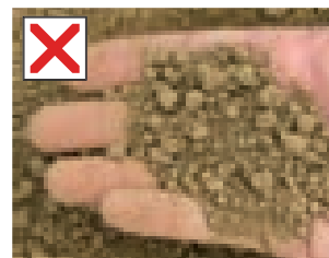
Desprovisto de tierra.