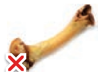
El istiyamar con huesos.