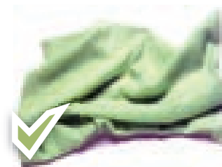
El istiyamar con tela.

Entre las cosas que se suele usar para el istiyamar tenemos el papel higiénico, servilletas de papel y, en casos de emergencia, piedras limpias o tela, etc.