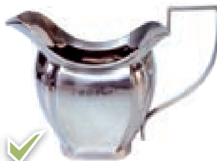
Jarro de plata para el wudu’.