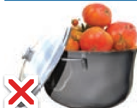
Comer en un recipiente de plata.