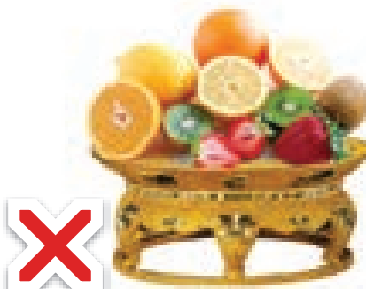
Comer en un recipiente de oro.