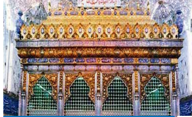
কবরে বাতি দেয়া অথবা তেল মাখানো জায়েয নয় ❌