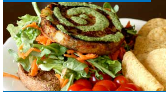
মাইয়েতের পরিবার পরিজনদের জন্য খাবার তৈরি করা